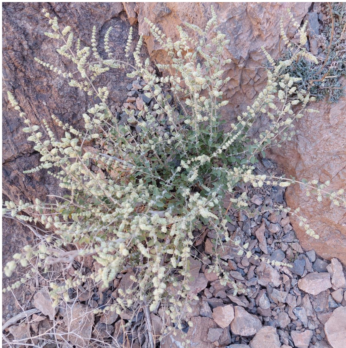
آباد، کیلومتر ۱۵ شمال شرقی