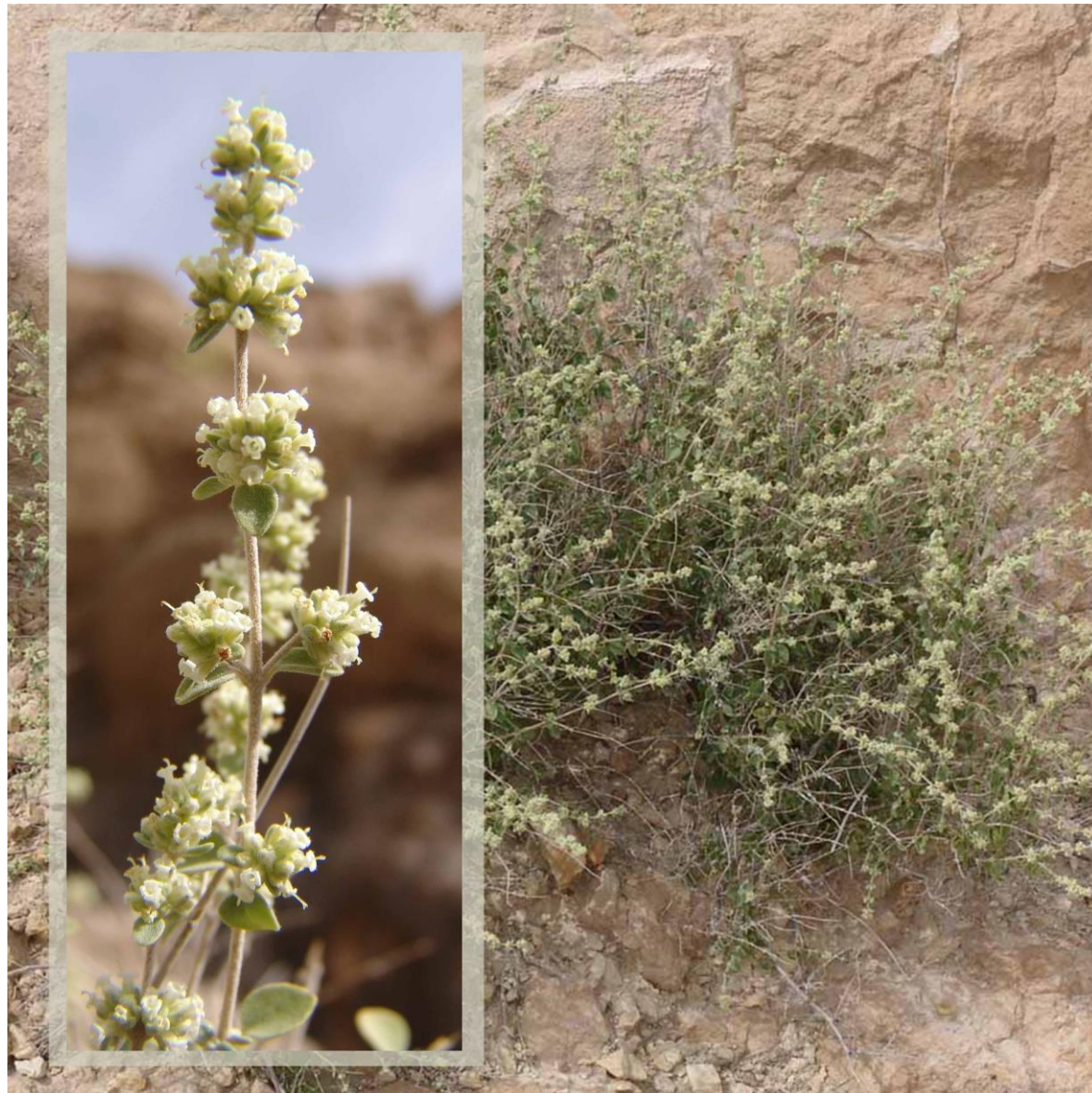
کامفیروز، تنگ بستانک