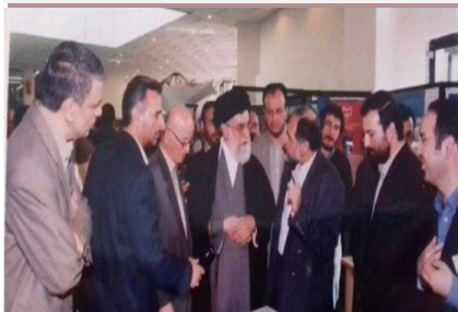
حضور مقام معظم رهبری (مد ظله) در دانشگاه شهید بهشتی، اردیبهشت ۱۳۸۲

امضای تفاهم نامه دو جانبه‌ای بین دانشگاه شهید بهشتی و دانشگاه بین‌المللی اهل بیت با هدف توسعه همکاری‌های مشترک و به منظور استفاده بهینه از ظرفیت‌های علمی-پژوهشی منعقد شد. به گزارش روابط عمومی دانشگاه، طی نشست‌هایی که در دفتر رئیس دانشگاه شهید بهشتی برگزار شد، این